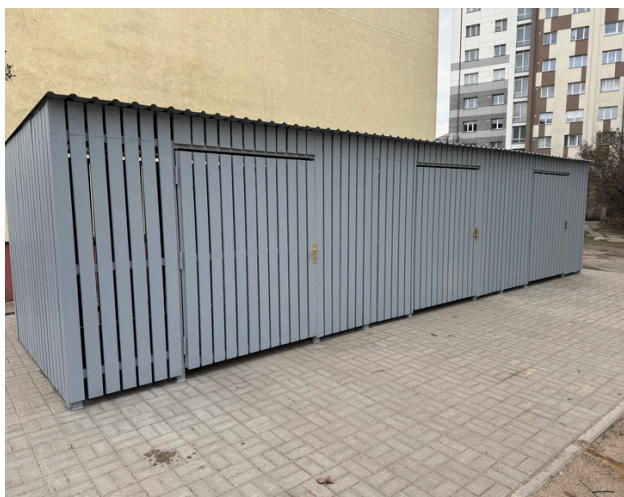
*Bildet viser tre sammenkoblede moduler